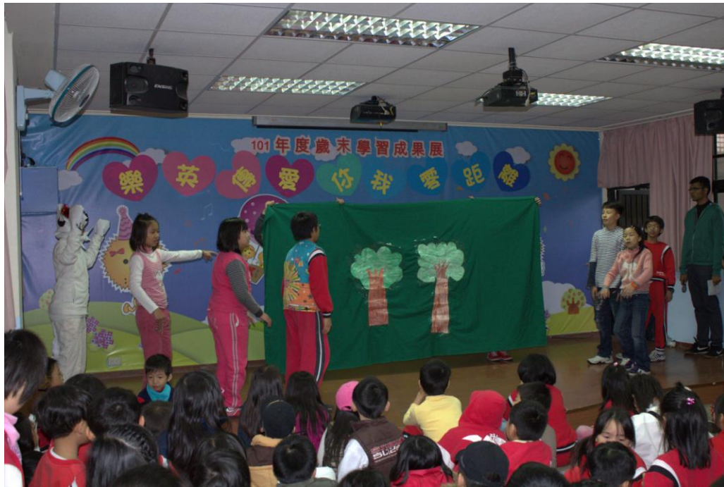
圖一： Uh! Uh! A forest! A big dark forest.