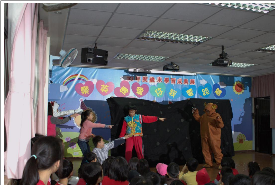
圖三:WHAT'S THAT? IT'S A BEAR!