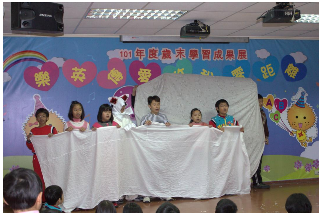
圖四: Into the bedroom. Into bed. Under the covers. I'm not going on a bear hunt again.