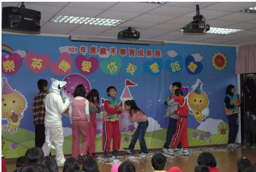
圖二： Uh! Uh! A snowstorm. A swirling whirling snowstorm