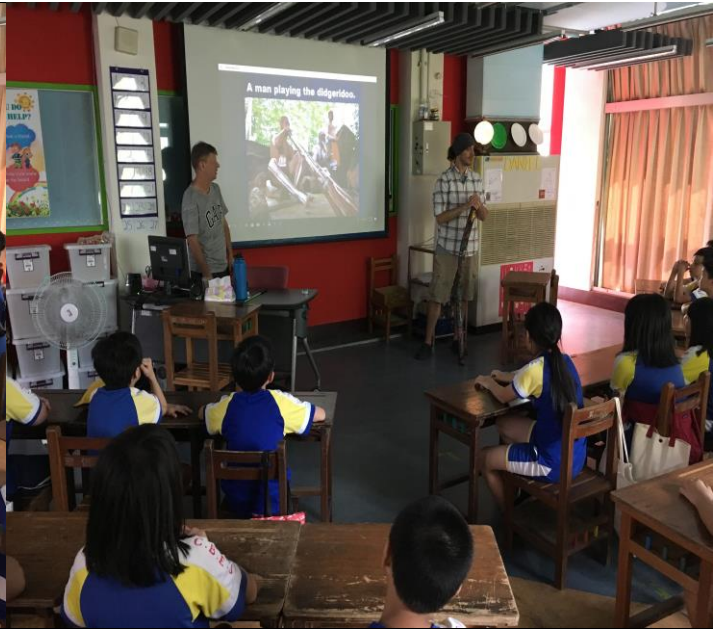
外師介紹澳洲原住民樂器