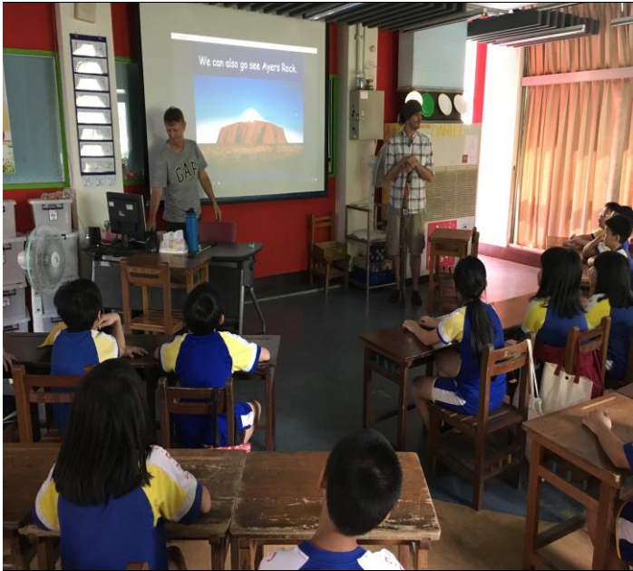
外師介紹澳洲著名的 Uluru 國家公園